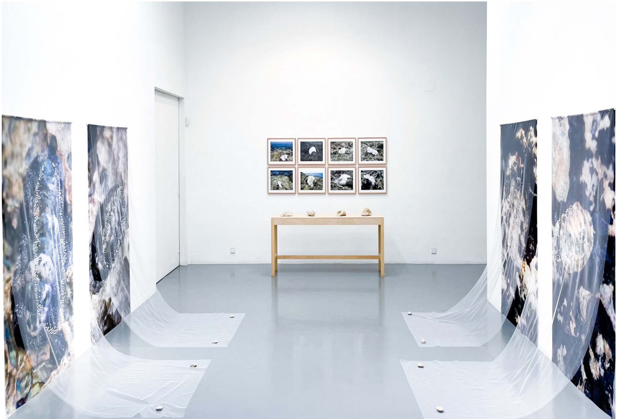
Ojos de hueso. Serie I. Serie de ocho impresiones fotográfica sobre tela por sublimación. Tela, silicona. 200 x 120 cm, unidad,. 2022