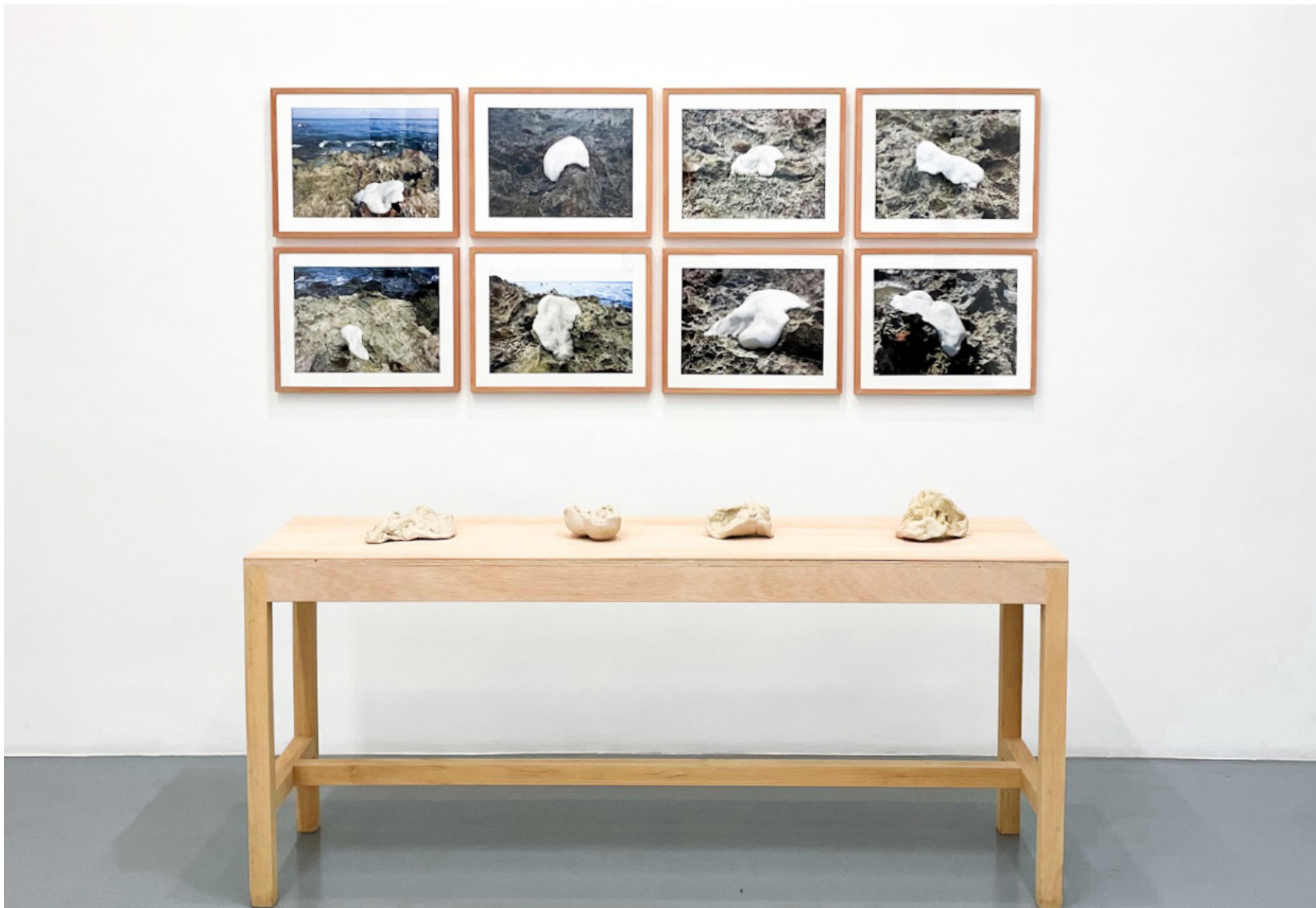
Ojos de hueso. Serie 2. Impresión digital de ocho fotografías sobre papel Hahnemühle 300 gr. 30 x 40 cm, unidad. 2022