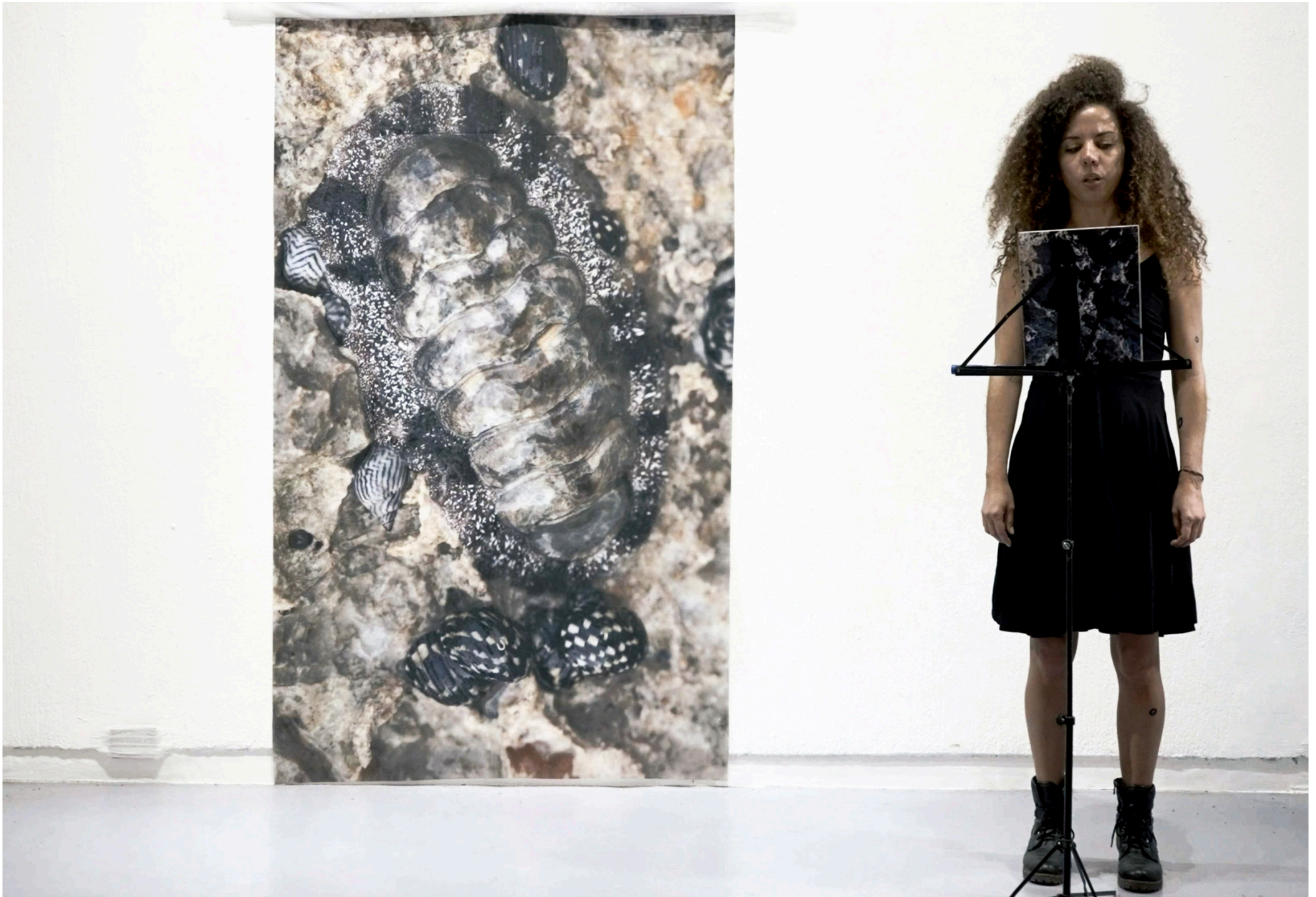
Ojos de hueso. Performance en video. 10". 2022