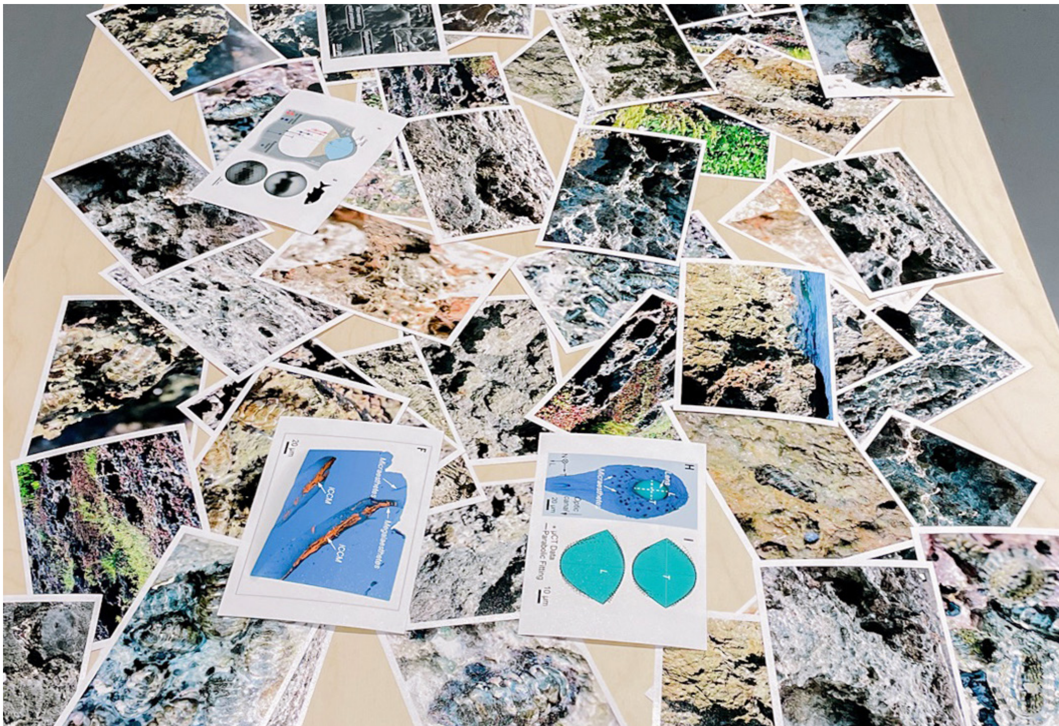
Archivo fotográfico producido por la artista durante el proceso de investigación. Fotos del medio ambiente de Los Quintones y esquema del funcionamiento de sus ojos