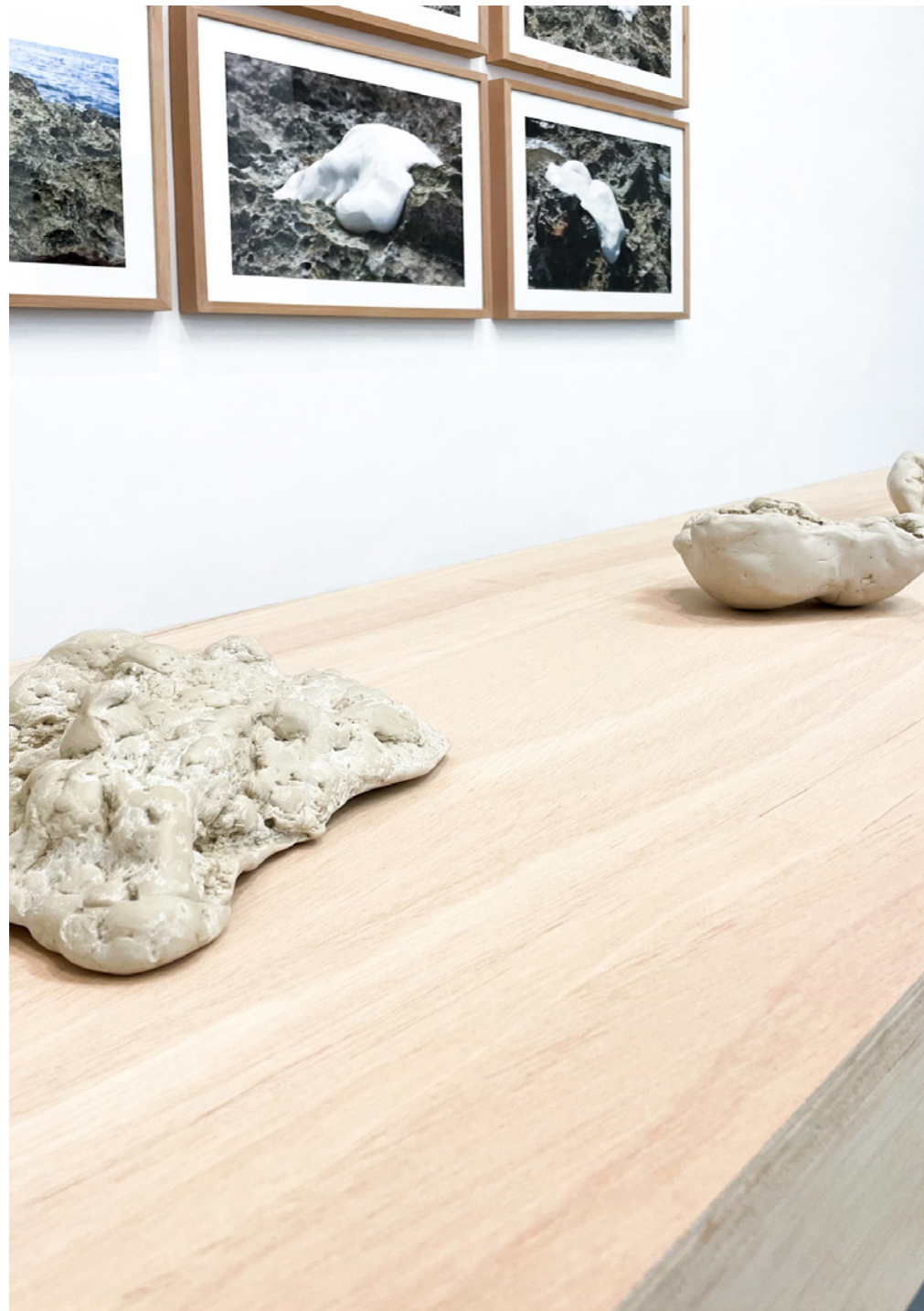
Ojos de hueso. Serie 3. Serie de cuatro esculturas de molde negativo y modelado. Plastilina epóxica. Dimensines varibles. 2022