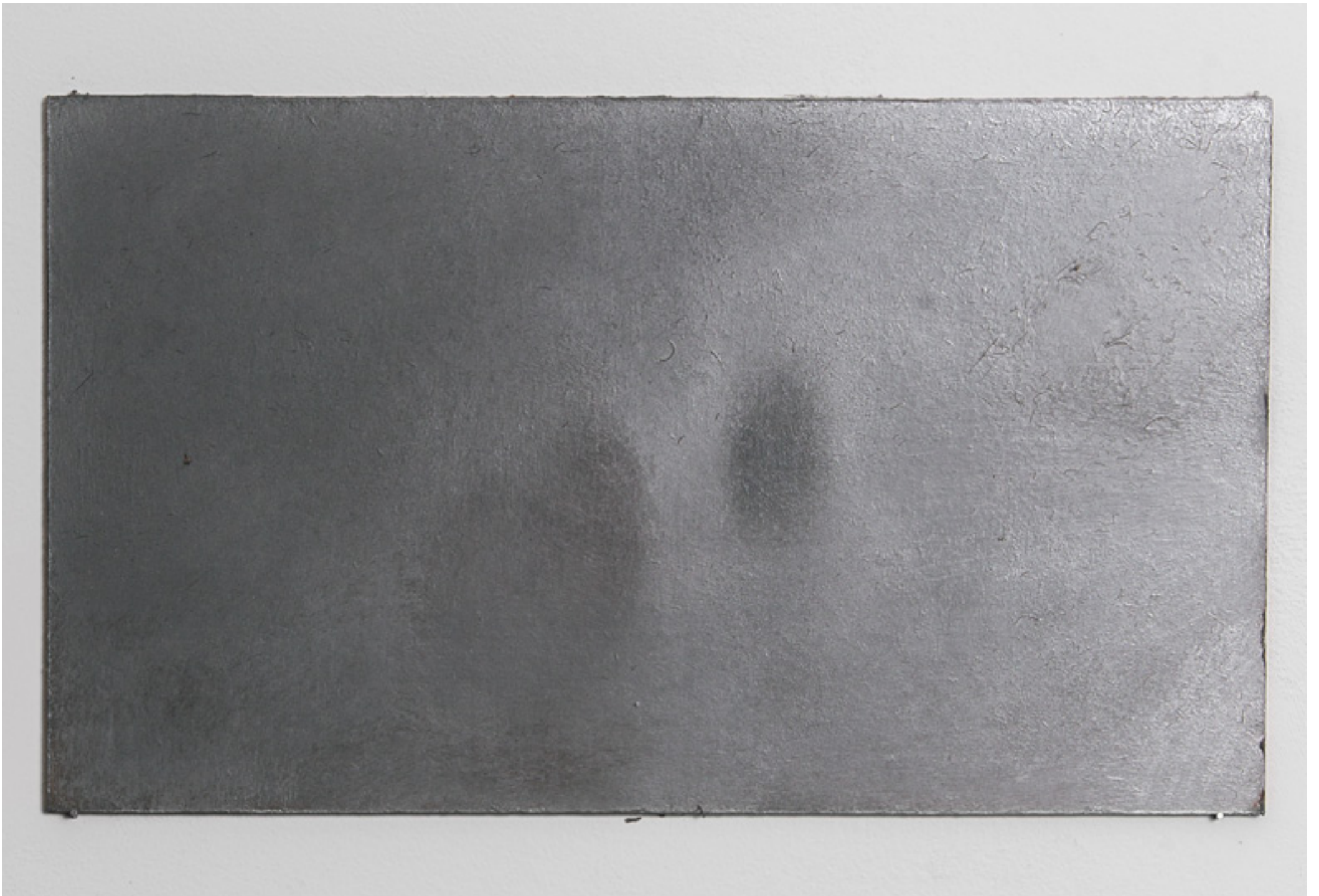
Matéria Negra 7. Esmalte sobre latex. 14 x 21 cm. 2017