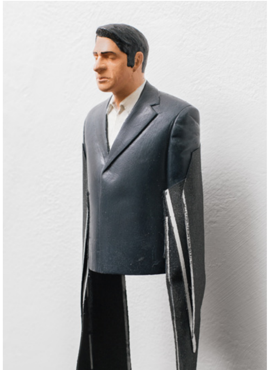
Big Hug. Resina, latón, tejido y pintura de esmalte. 60 x 7 x 6 cm. 2010/17