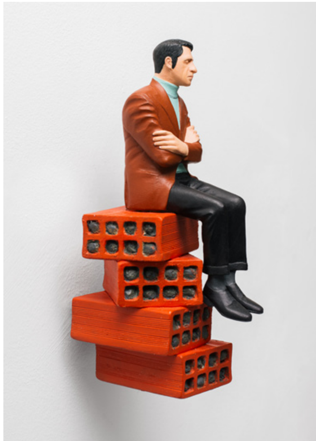
Sapiens, Sapiens N2. Bronce y pintura de esmalte. 23,5 x 9 x 12 cm. 2007/17