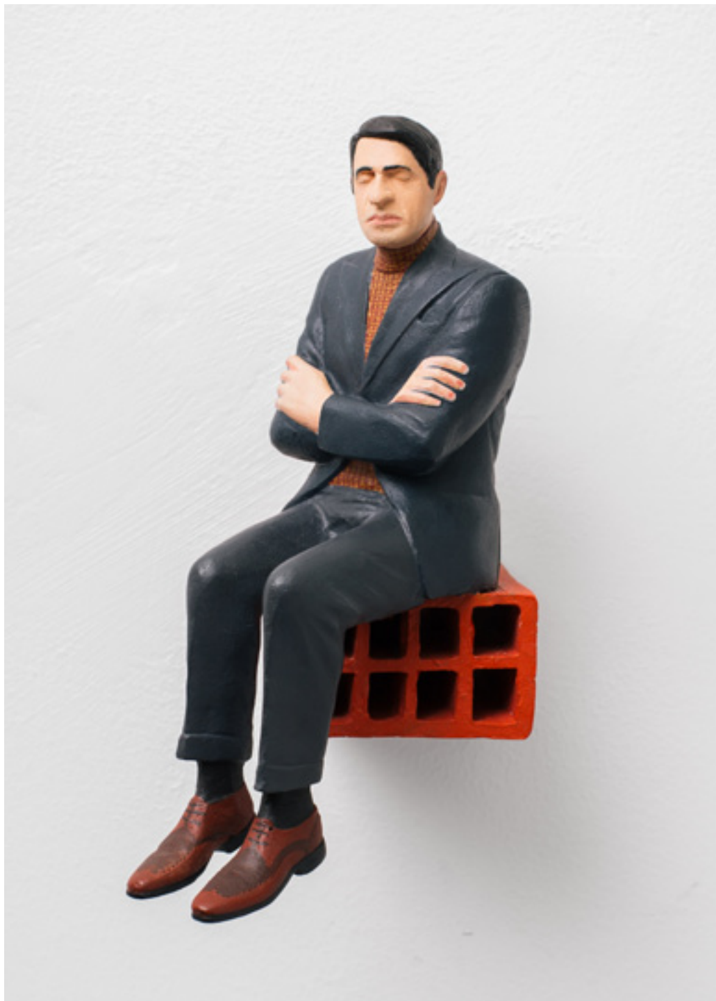
Sapiens, Sapiens N1. Bronce y pintura de esmalte. 18 x 9 x 14 cm. 2007/17