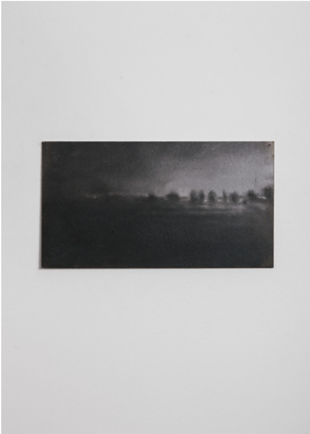
Matéria Negra 1. Esmalte sobre platex. 32 x 81 cm. 2017