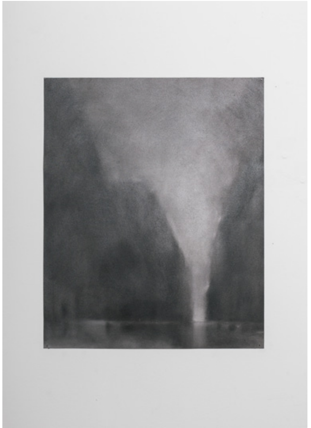
Matéria Negra 5. Esmalte sobre platex. 20 x 34 cm. 2017