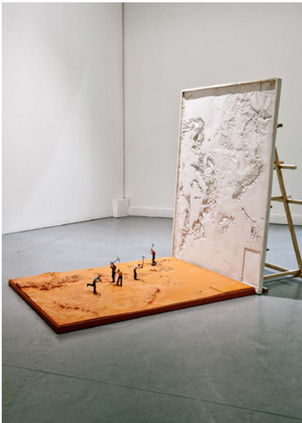
Livro de boas maneiras. Bronce, escayola y madera. 91 x 128 x 88 cm. 2008