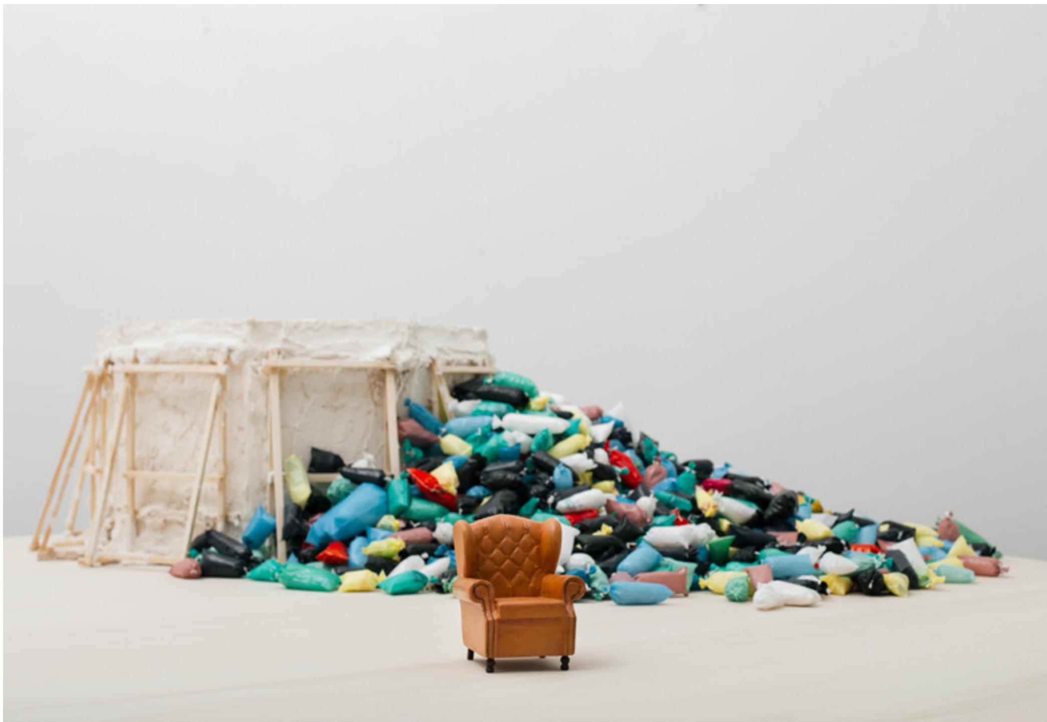
Summit, Once Again N2. Diversos materiales. 96 x 130 x 130 cm. 2016/17