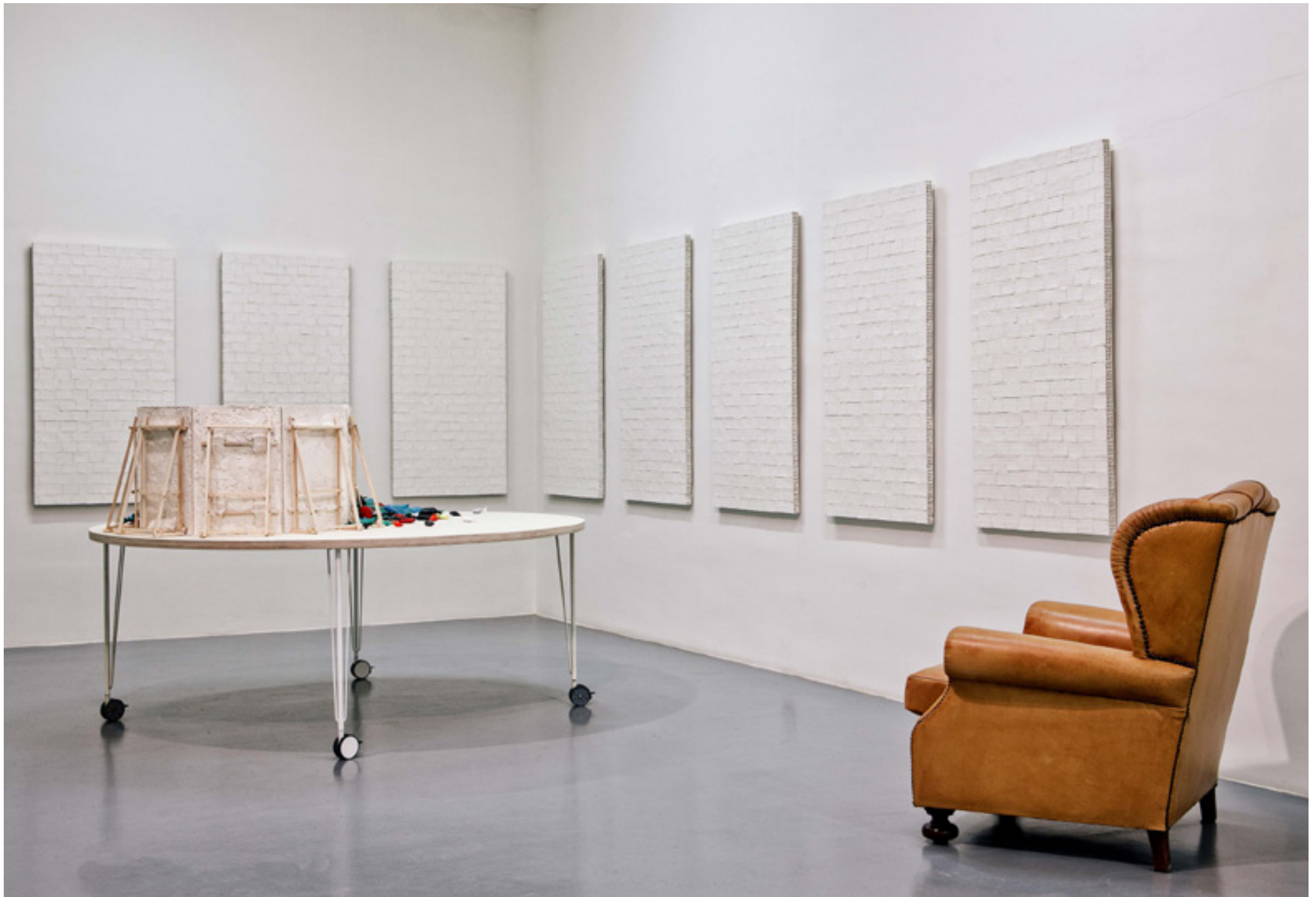
Summit, Once Again N1. Diversos materiales. Dimensiones variables. 2016/17