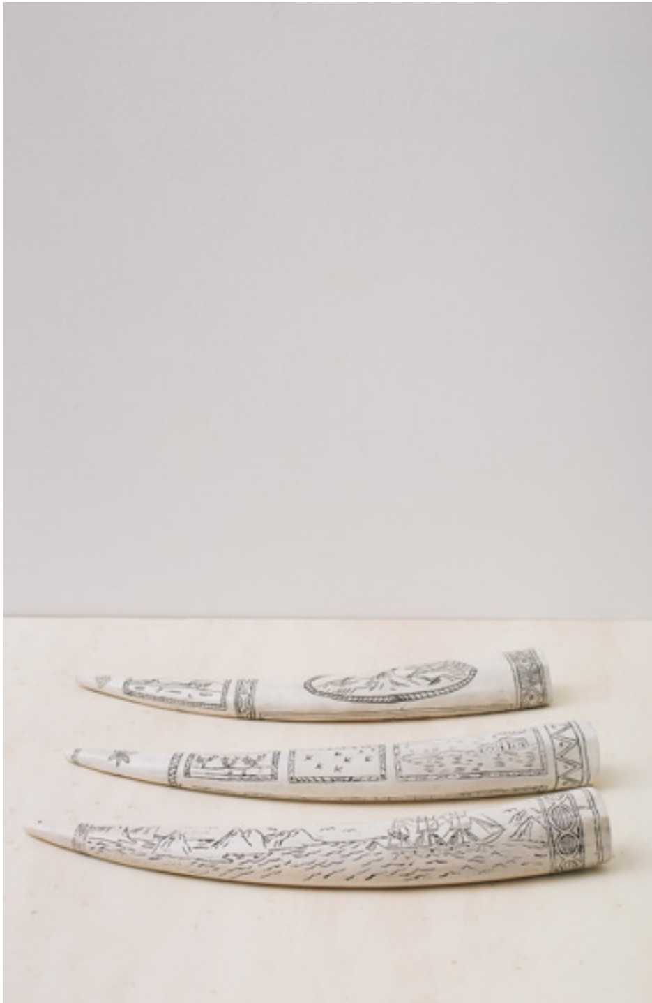
Série Trophies from North Atlantic. Técnica mixta. Dimensiones variables. 2009/17