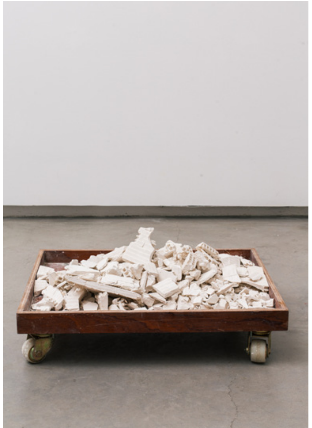
Puzzle. Yeso y madera. Dimensiones variables. 2017