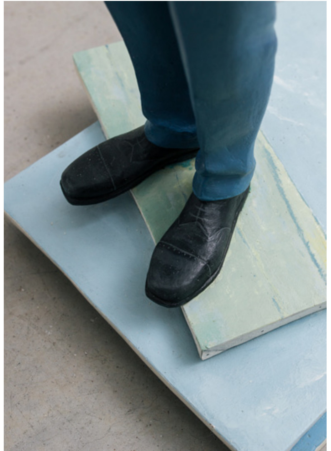
Recorriendo el paisaje. Bronce pintado y madera. Dimensiones variables. 2008