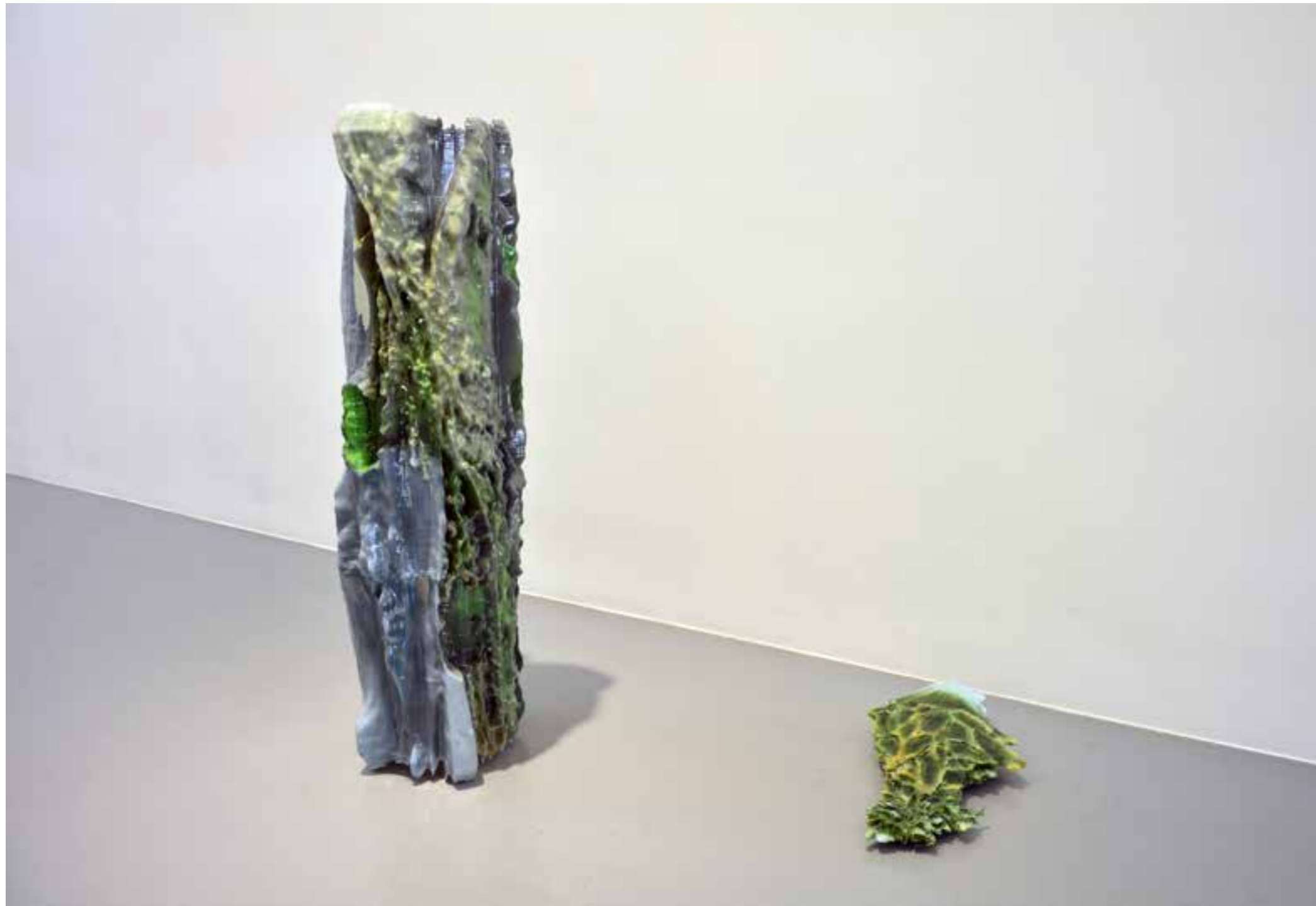
A plant whose leaves function as solar panels and are friendly to the landscape. Pintura acrílica y resina epoxi sobre impresión 3D. 25 x 77 x 10cm. 2021