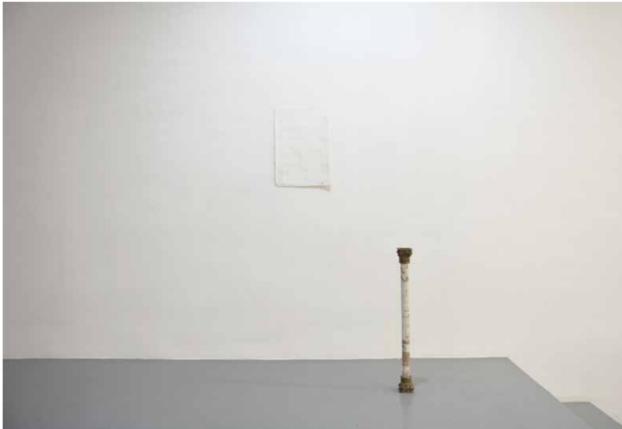
Abel Jaramillo. ST (Mover una columna) . Metal, papel craft y escayola. 81 x 8 x 8cm / ST (Dolmen) . Gofrado sobre papel 56 x 35cm. 2022