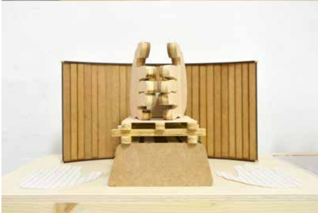
Miguel Ángel Cardenal. Pasto Amarillo, Barro Rojo. Madera, palma, mimbre, papel, tinta, grafito, metacrilato y barro cocido. Medidas variables. 2022