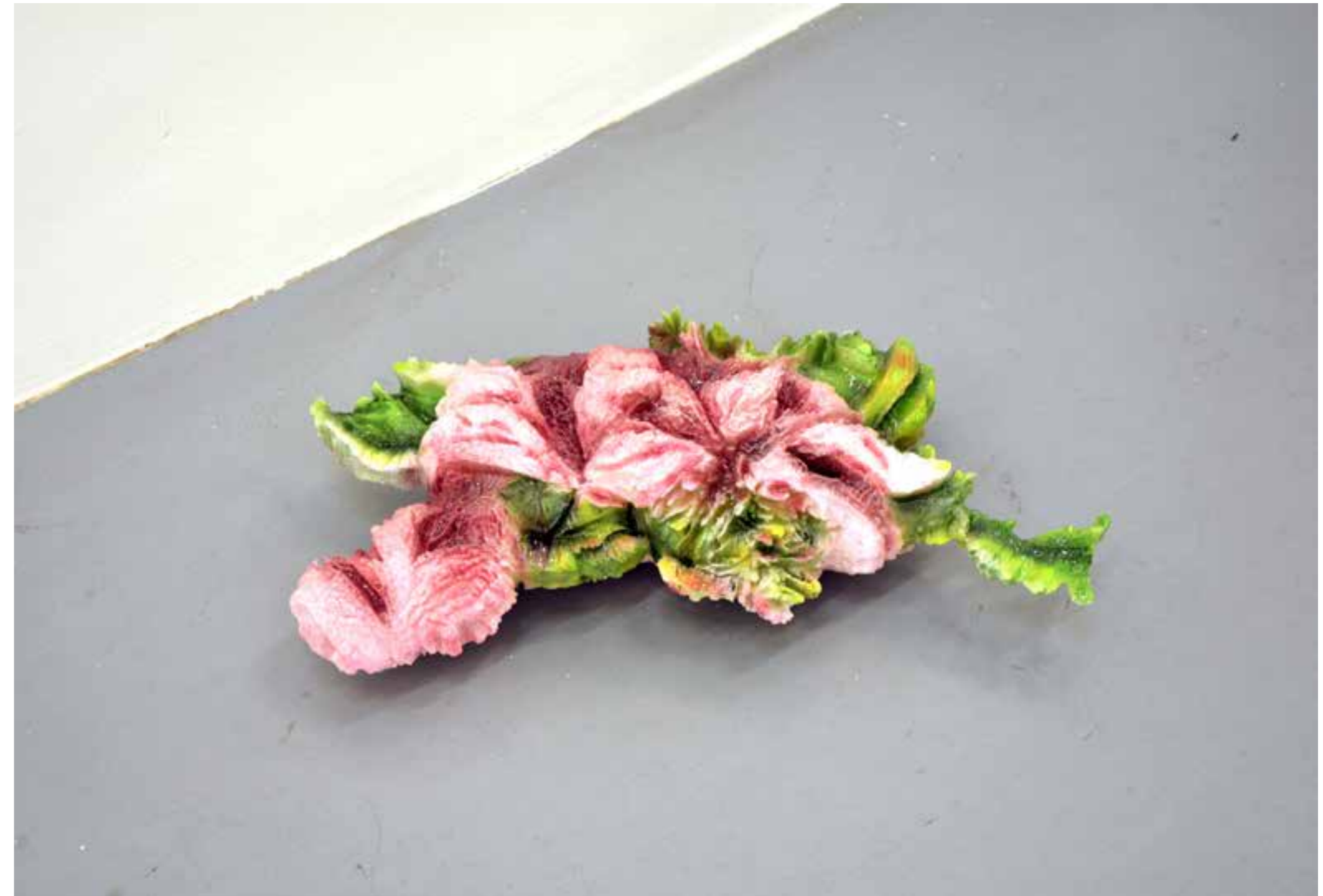
An aquatic flower to retain water and prevent hydroelectric power plants from draining reservoirs on a massive scale. Pintura acrílica y resina epoxi sobre impresión 3D. 20 x 75 x 22cm. 2021