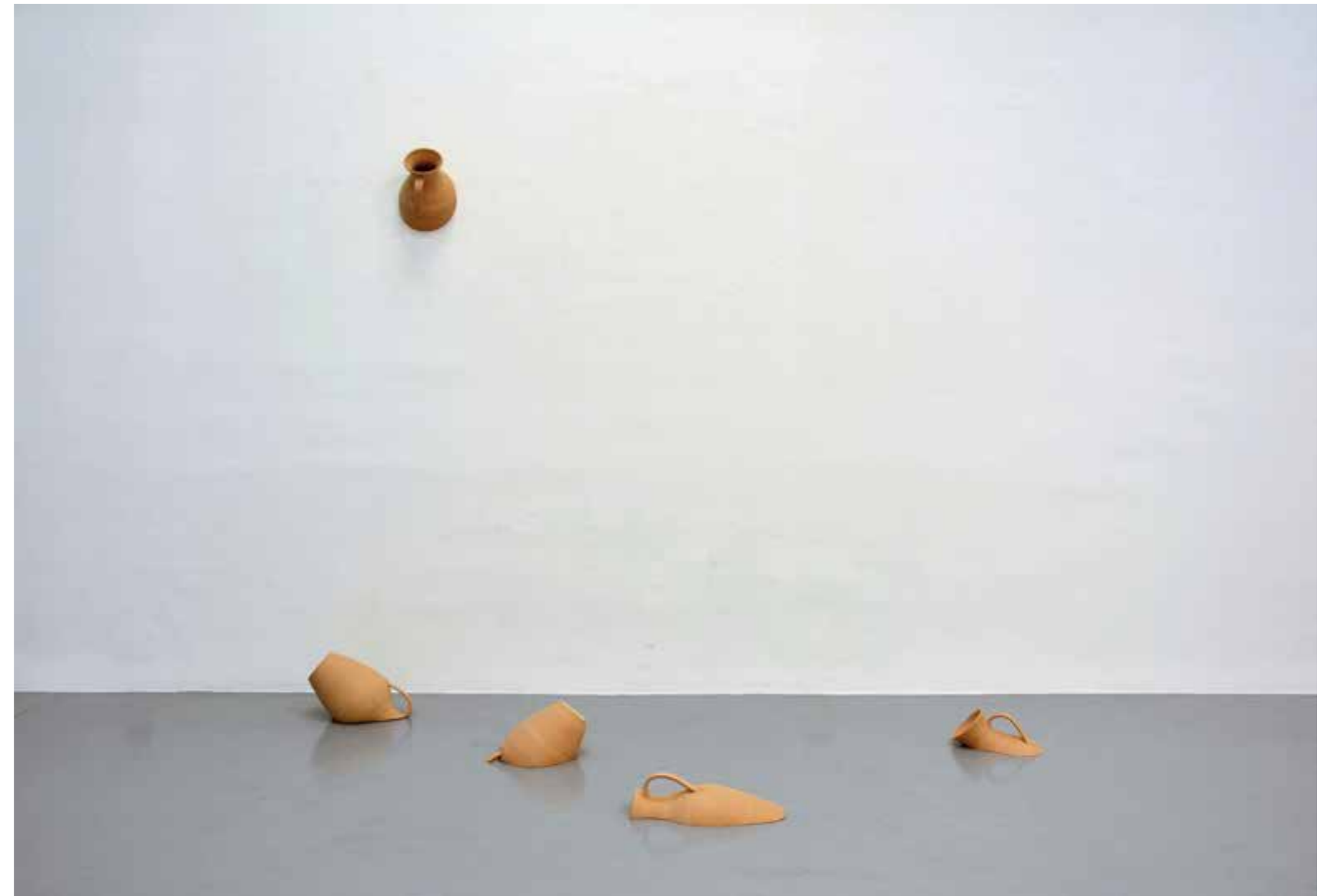
María León / Intersección de conjuntos ( Set Theory). #VII, #VIII, #IX,#X, #XI. Conjunto de cinco esculturas. Pasta cerámica y terracota. Medidas variables. 2021