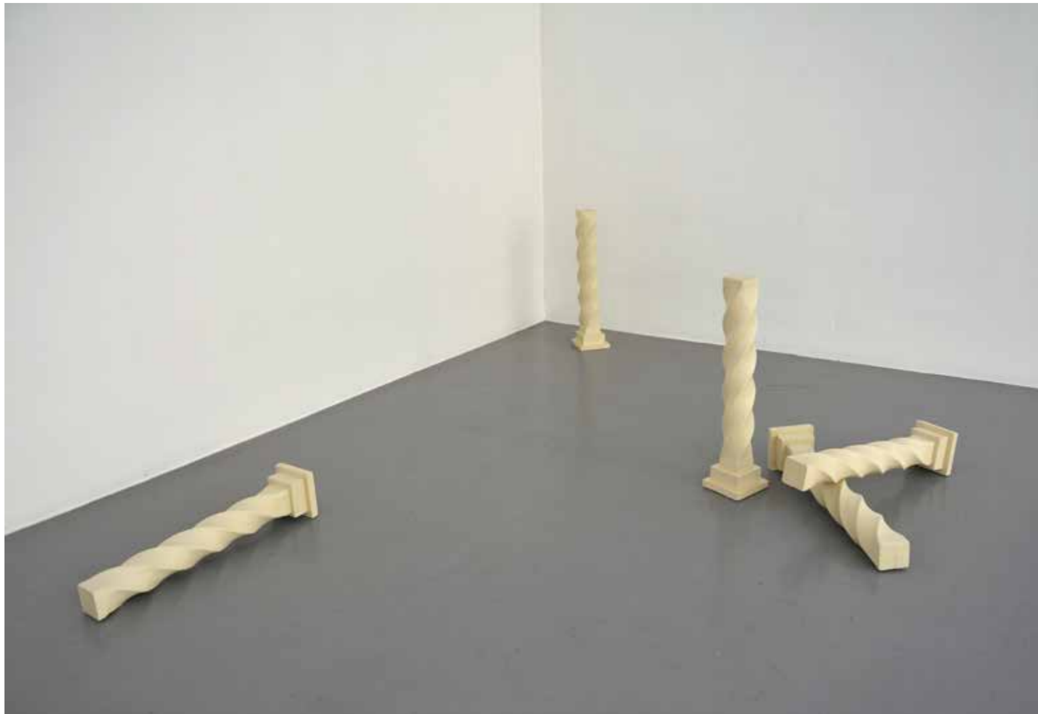
Abel Jaramillo. ST (Herencia). Columna de escayola. 51 x 11 x 11cm c.u. 2022