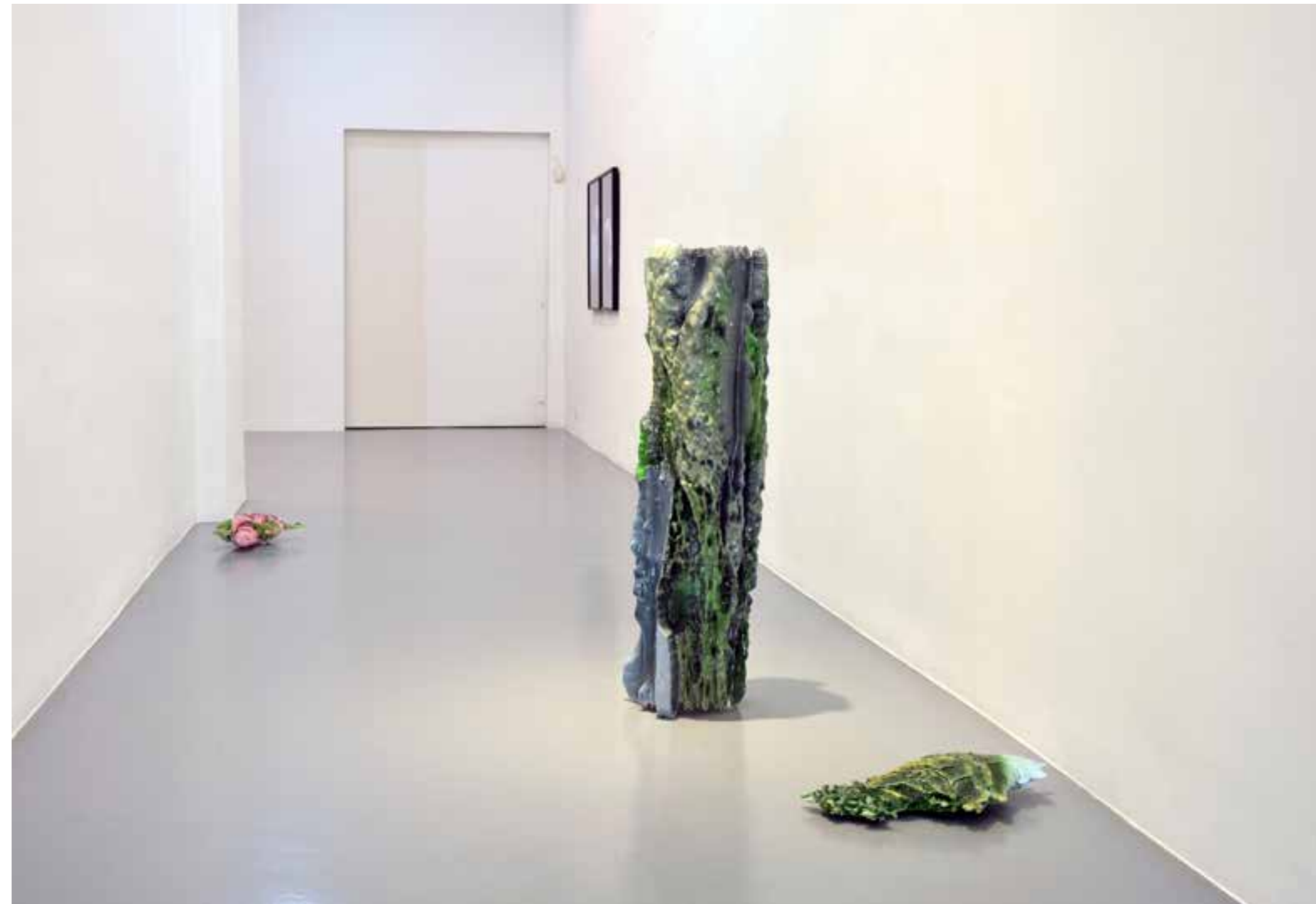
Lola Zoido / A fragment of a hollowed-out Extremadura whose only observer is an artificial intelligence. Pintura acrílica y resina epoxi sobre impresión 3D. 35 x 3 5x 120cm. 2021