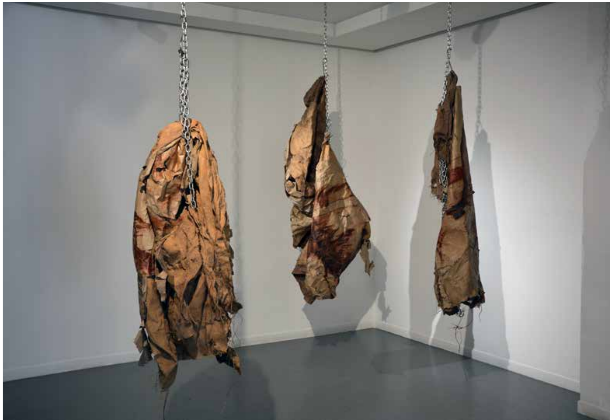
Pablo del Pozo. Res penjat_1_2_3. Óleo sobre papel kraft encolado en tela de yute, gancho y cadena de acero. Medidas variables. 2021