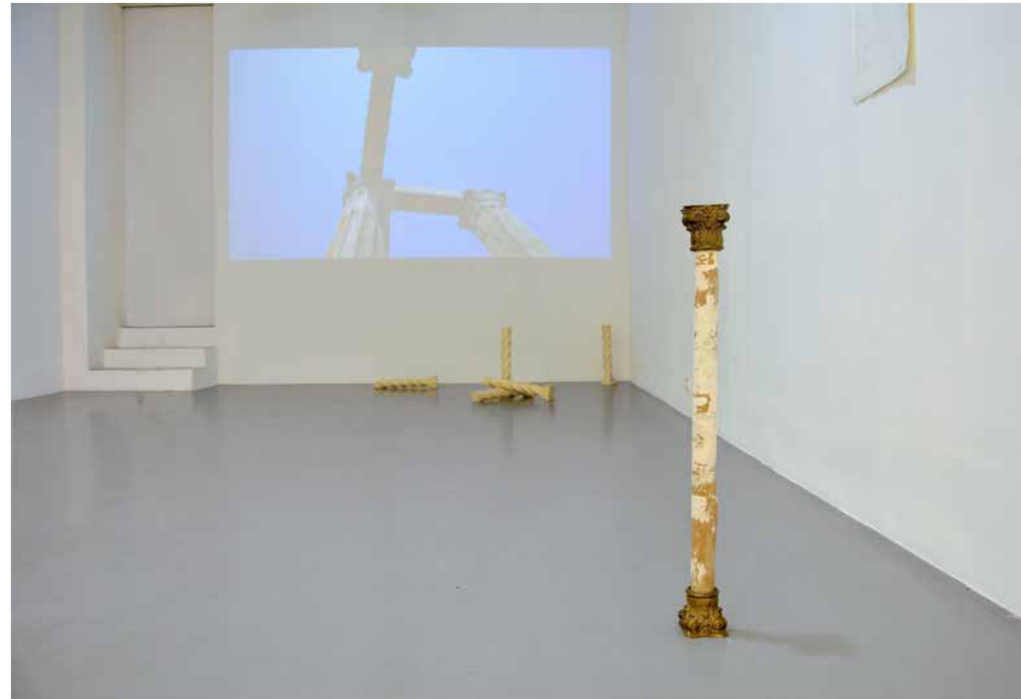
Abel Jaramillo. Heredar la ruina . Vídeo Full HD Color, sonido. 12' 31". 2022