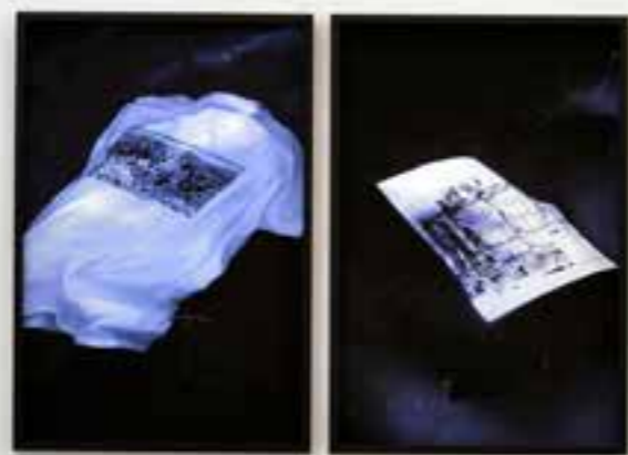
Abel Jaramillo. Superficie/espalda-Piedra/profundidad. Díptico fotográfico Impresión digital sobre papel Hahnemühle. 90 x 120cm. 2022