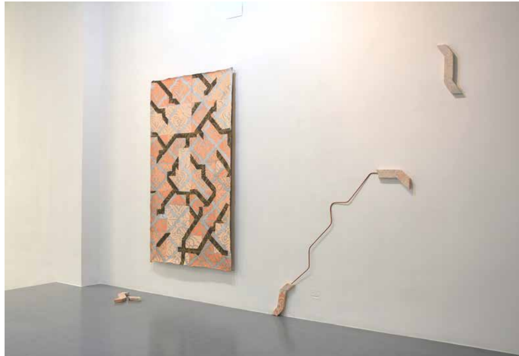
Paula Valdeón Lemus / Aquí estaba el salón, dijéramos. Óleo y grafito sobre lino, varilla de cobre y cerámica esmaltada. 2022