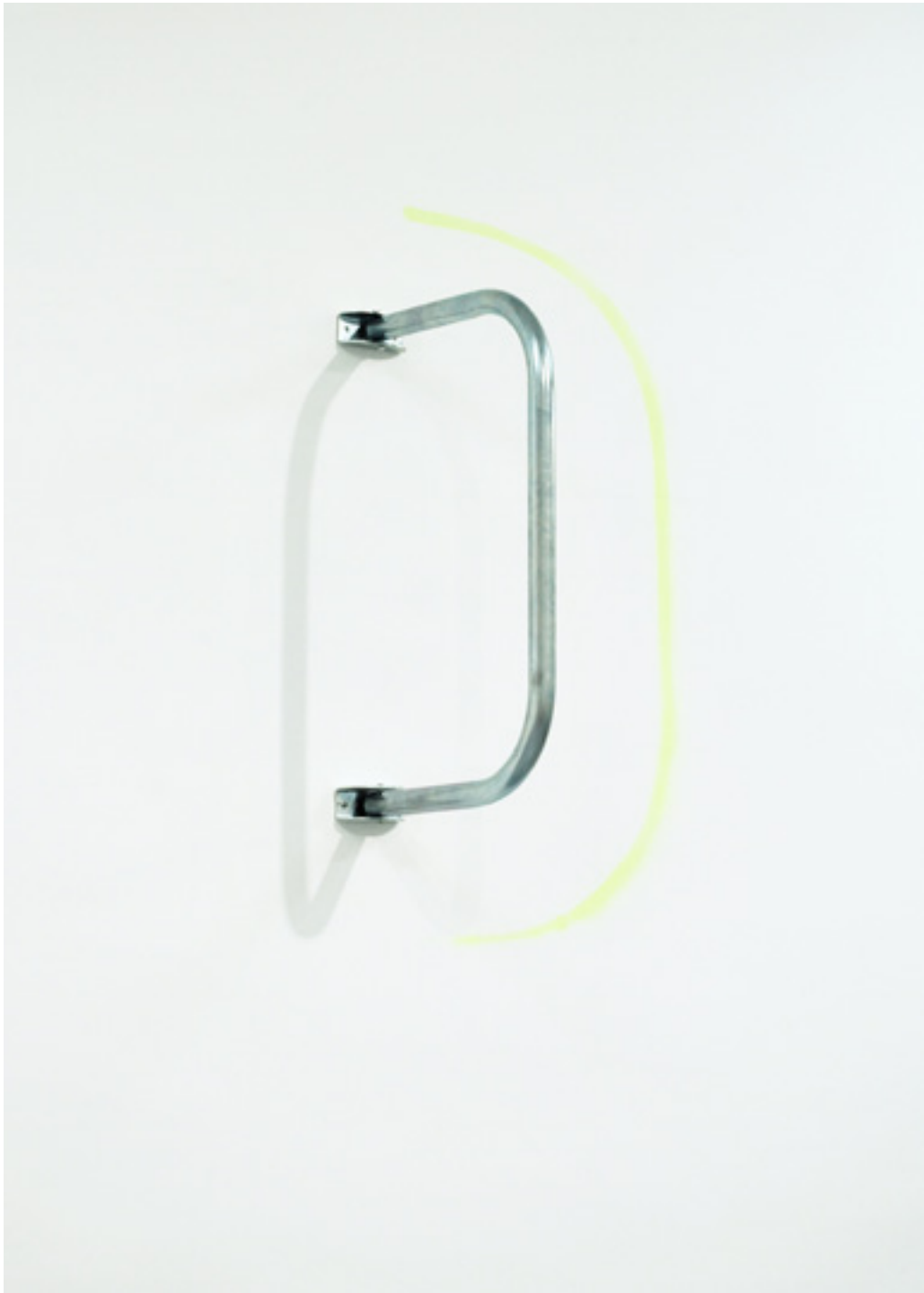
Powerline amarillo. Soporte acero, pintura acrílica en spray. Medidas variables. 2016