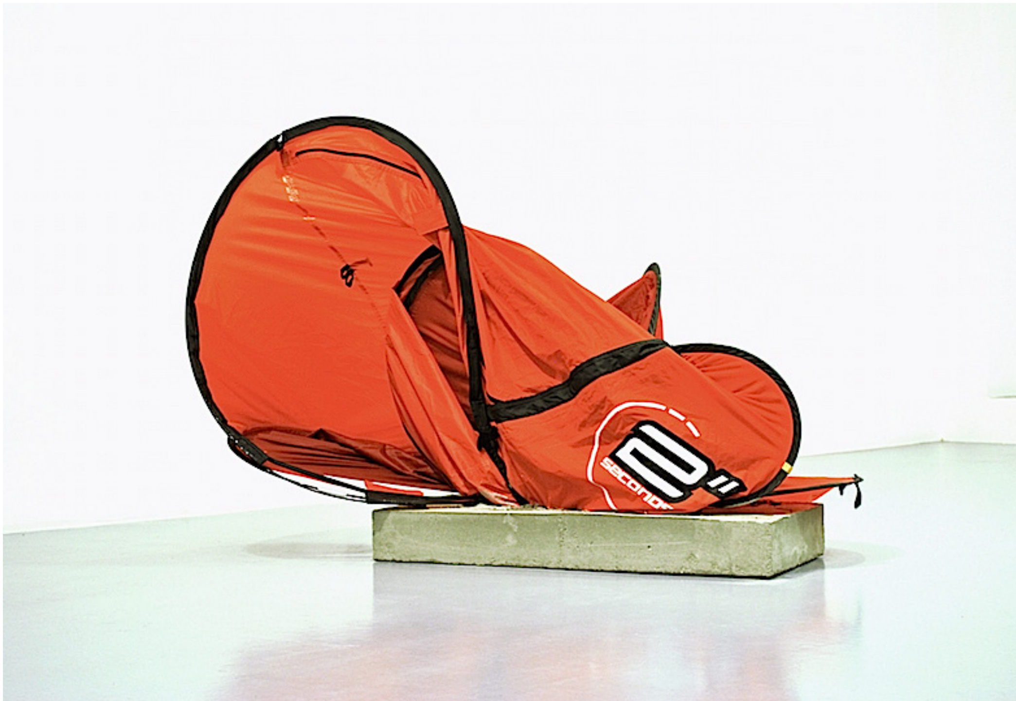
1 second roja. Tienda de campaña 2 seconds y peana de cemento. Medidas variables. 2016