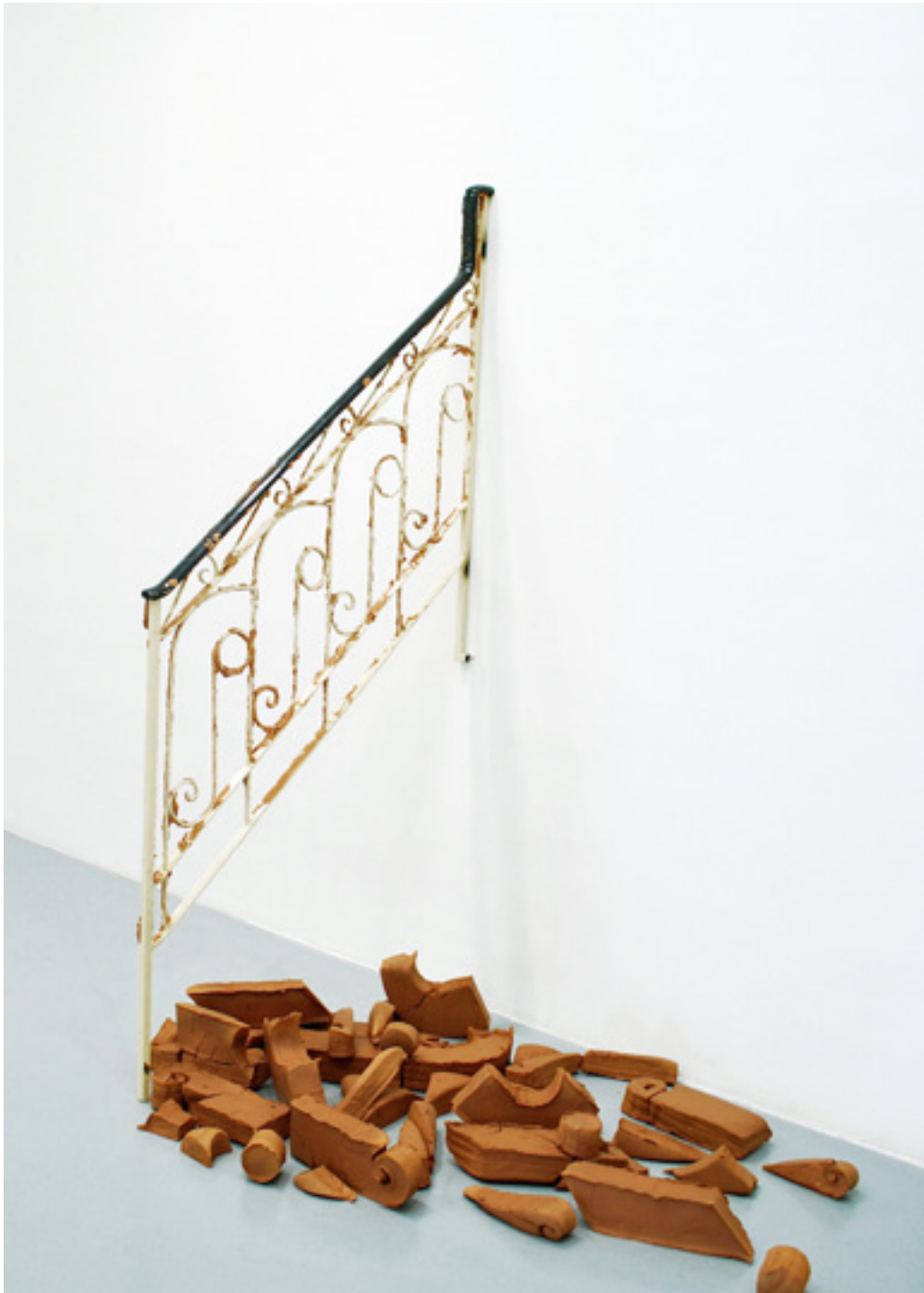
Powerline barro. Barandilla de hierro, barro. Medidas variables. 2016