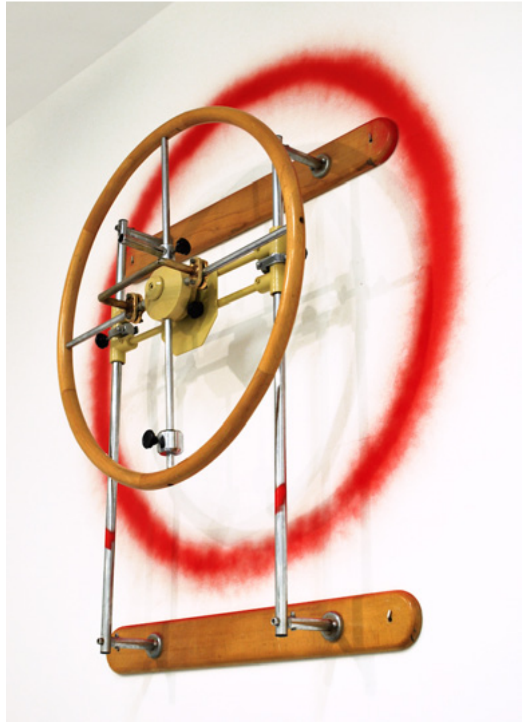
Powerline rojo. Rueda de hombro, pintura en spray. 90 x 110 x 35 cm. 2016