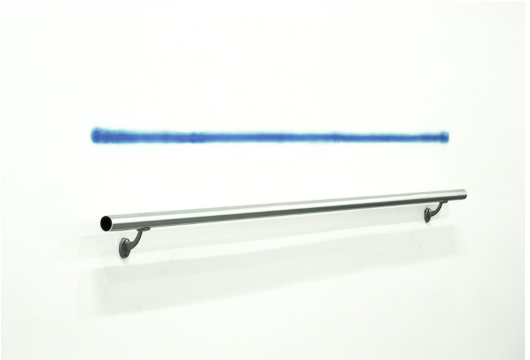
Powerline azul. Pasamanos acero, pintura acrílica en spray. Medidas variables. 2016