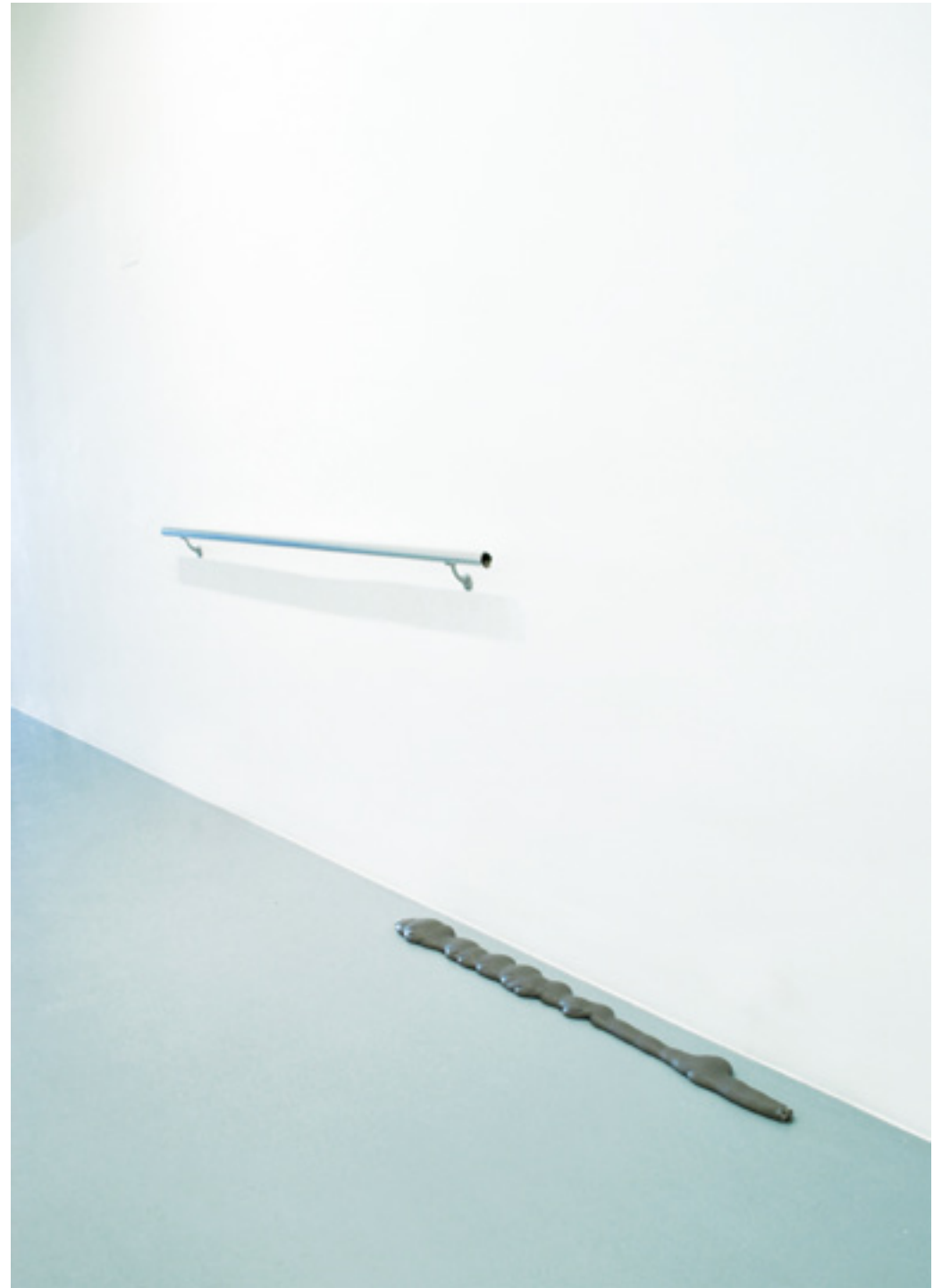
Powerline masa. Pasamanos de aluminio, masa flexible. Medidas variables. 2016