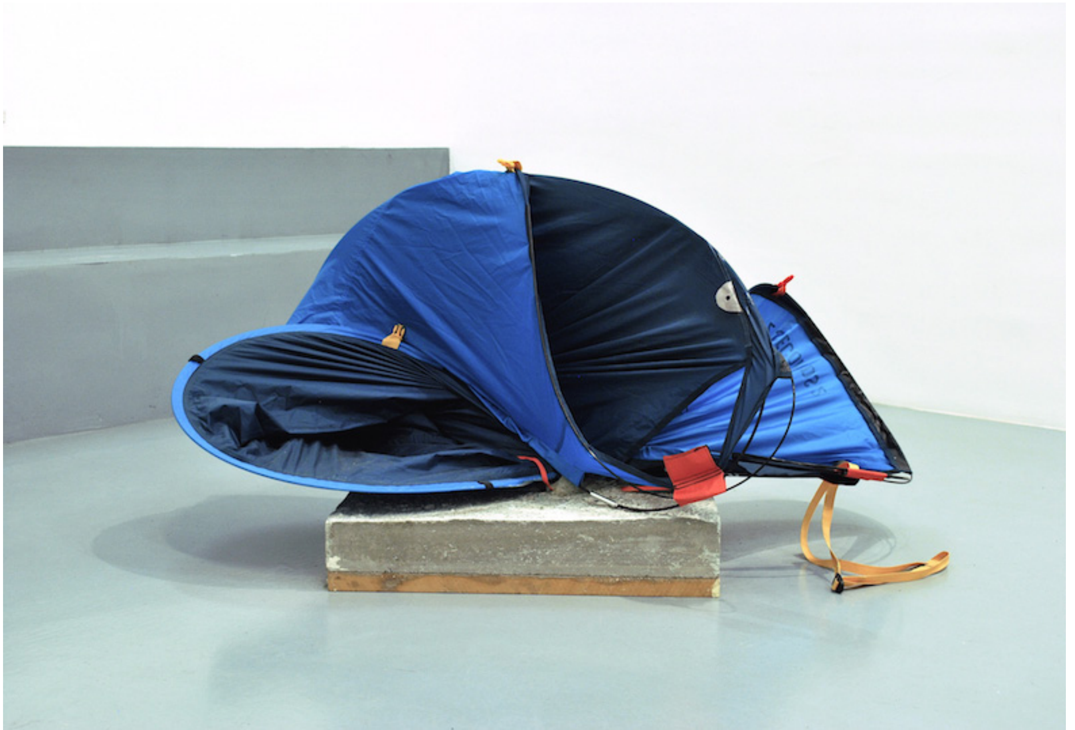
1 second Azul. Tienda de campaña 2 seconds y peana de cemento. Medidas variables. 2016