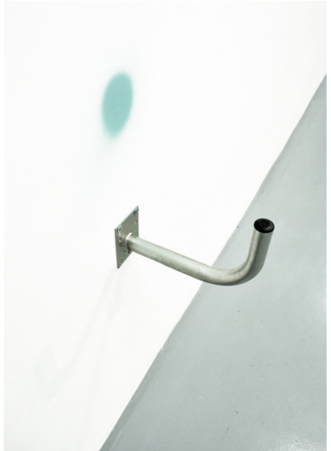
Powerline verde. Soporte acero, pintura acrílica en spray. Medidas variables. 2016