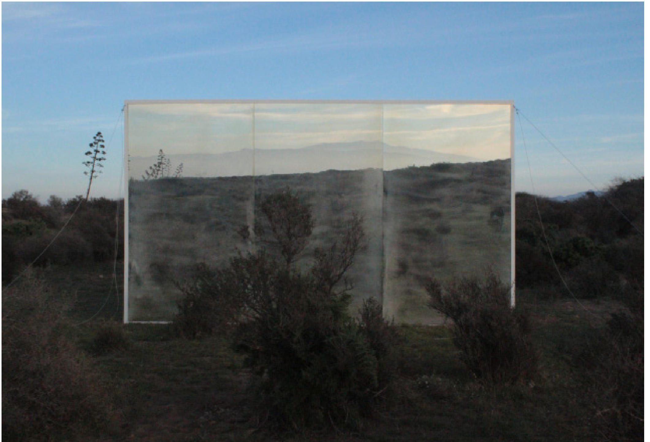
Solo el cielo lo sabe. Fotografía digital sobre cristal bañado en plata 60 x 91 x 10cm. 2017