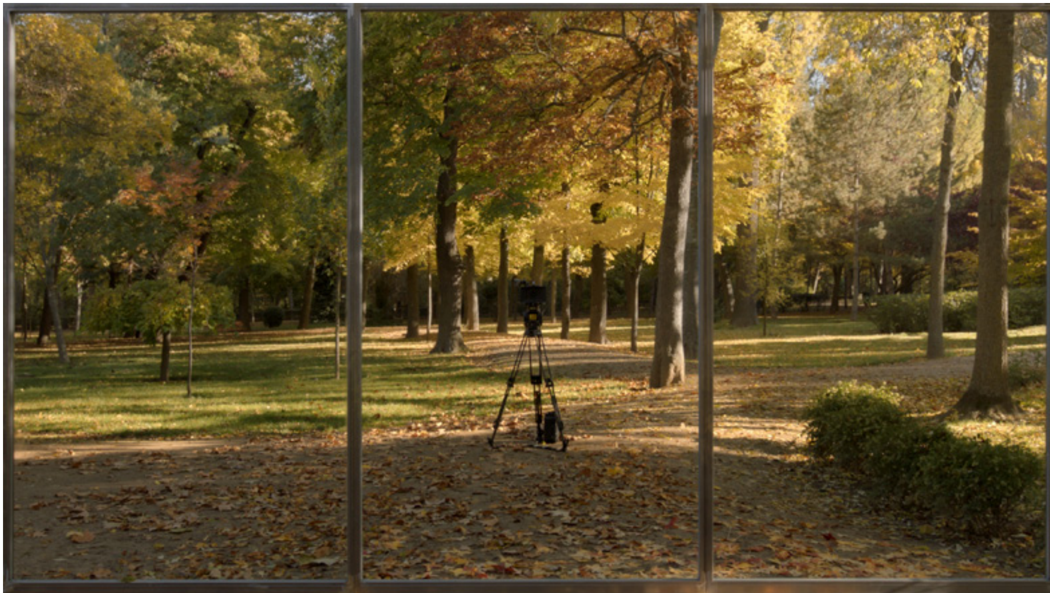
Imitación a la vida. Videoinstalación. Master 2K. 20' 46". 2017