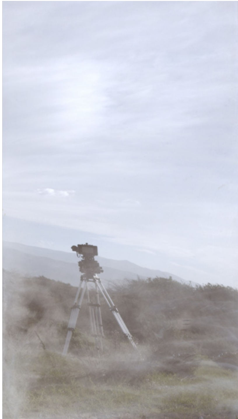
Written on the wind. Videoinstalación. Dos proyecciones sincronizadas. Master 2K. 270 x 160 cm unida. 2016