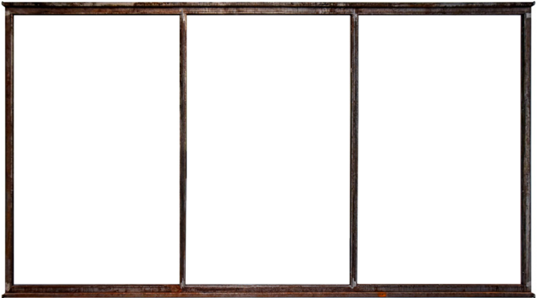
Marco de hierro para la grabación de un vídeo. Hierro. 280 x 500 x 8 cm. 2016