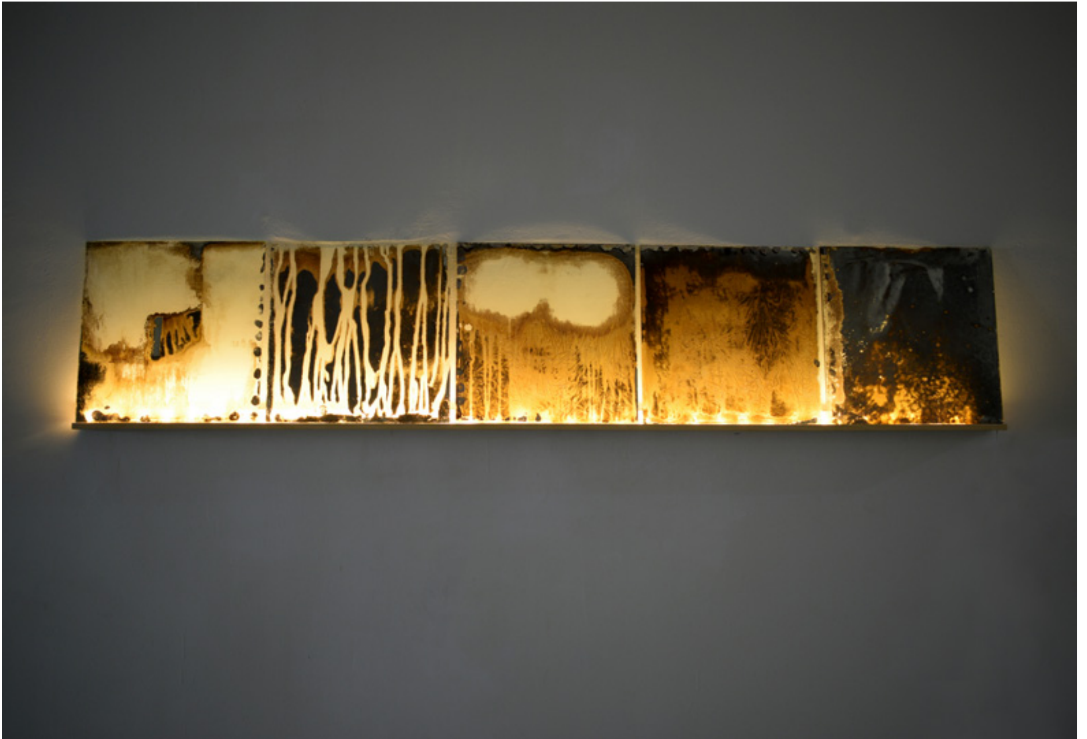
Pruebas de borrado para la realización de un vídeo. 6 cristales retroiluminados plateados con Ion de plata e intervenidos con líquido reactivo. 25 x 15 x 5cm. 2016