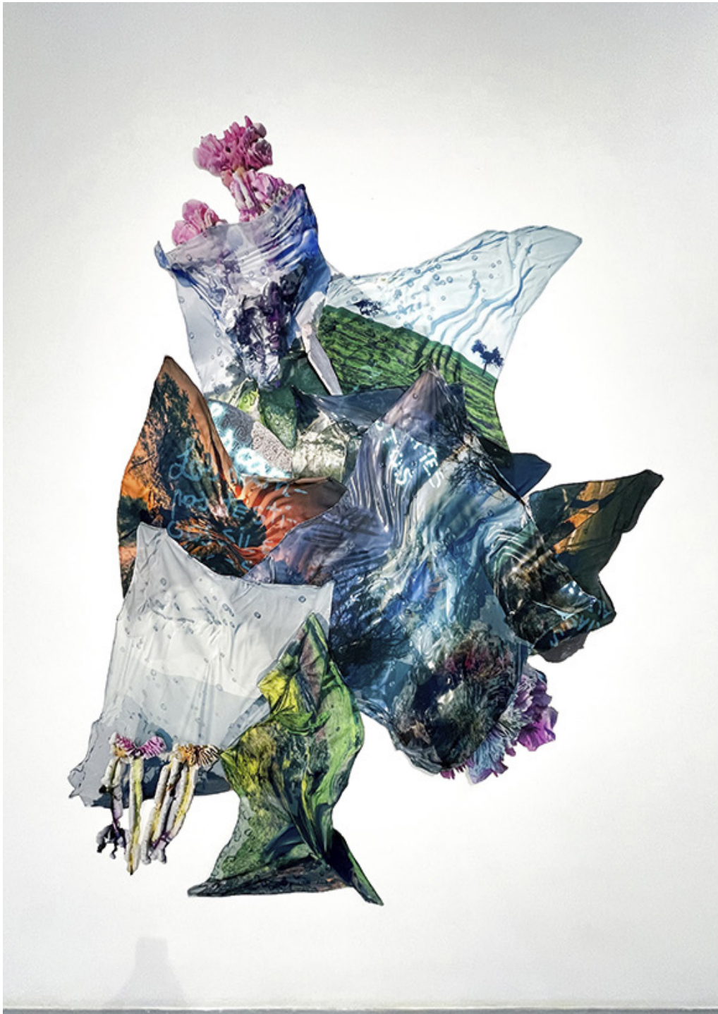
El cuento del poema de Carolina Colorado. Impresión textil sobre semiseda y polipiel. 300 x 250 cm. 2023