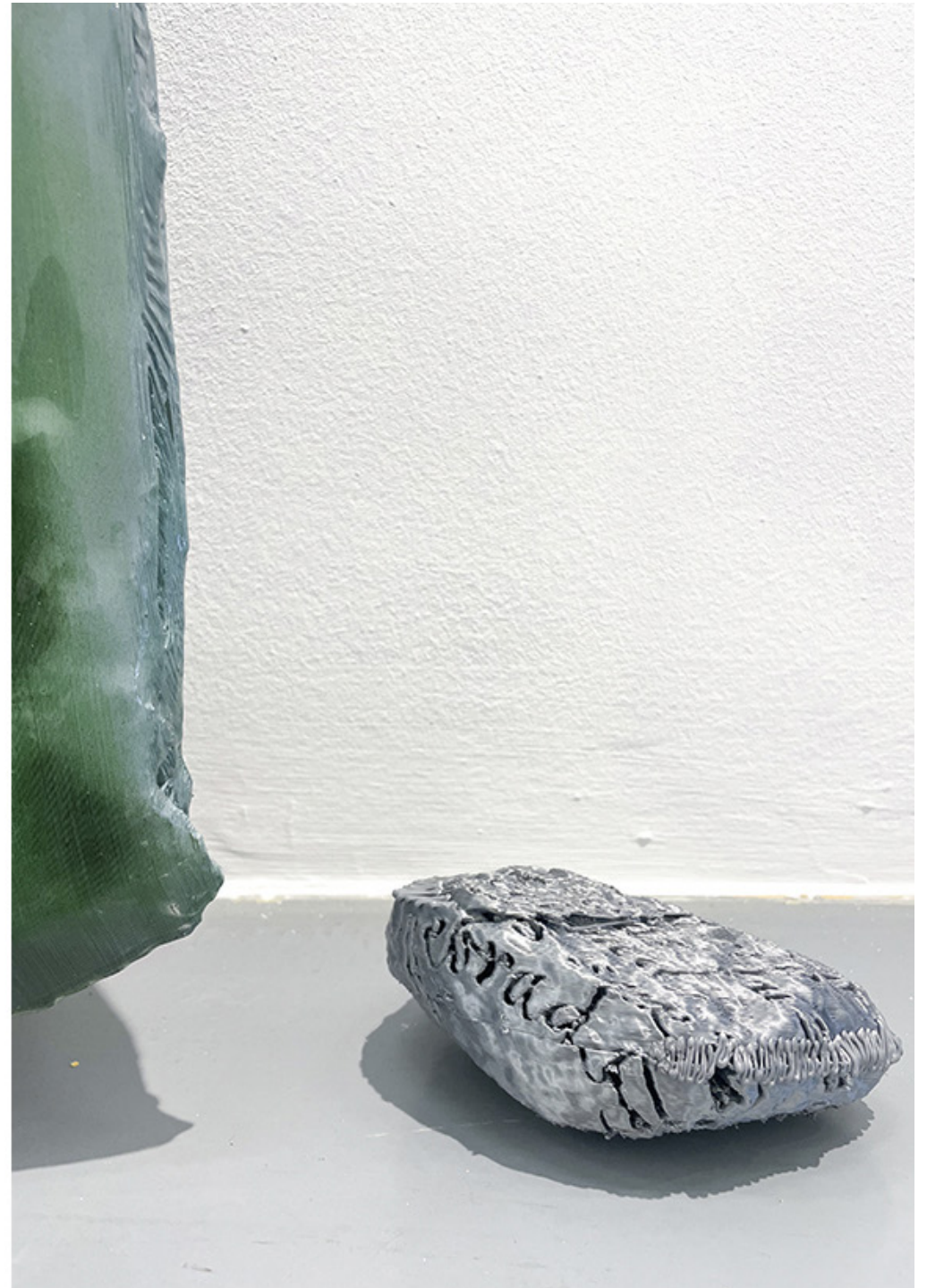
A future epitaph for today's society (3). Pintura acrílica y resina epoxi sobre impresión 3d en PLA. 147 × 60 × 17 cm. 2023