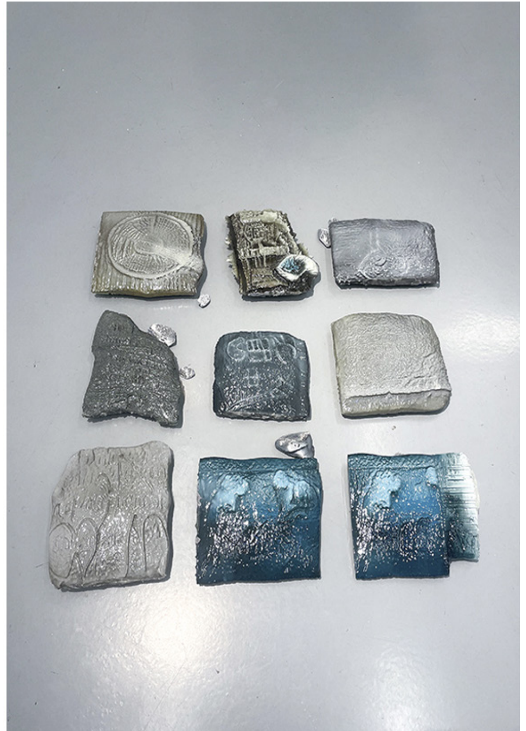
Future narrations (engraved in stone because there will be no screens left) 1/9. Pintura acrílica y resina epoxi sobre impresión 3d en PLA. Medidas variables. 2023