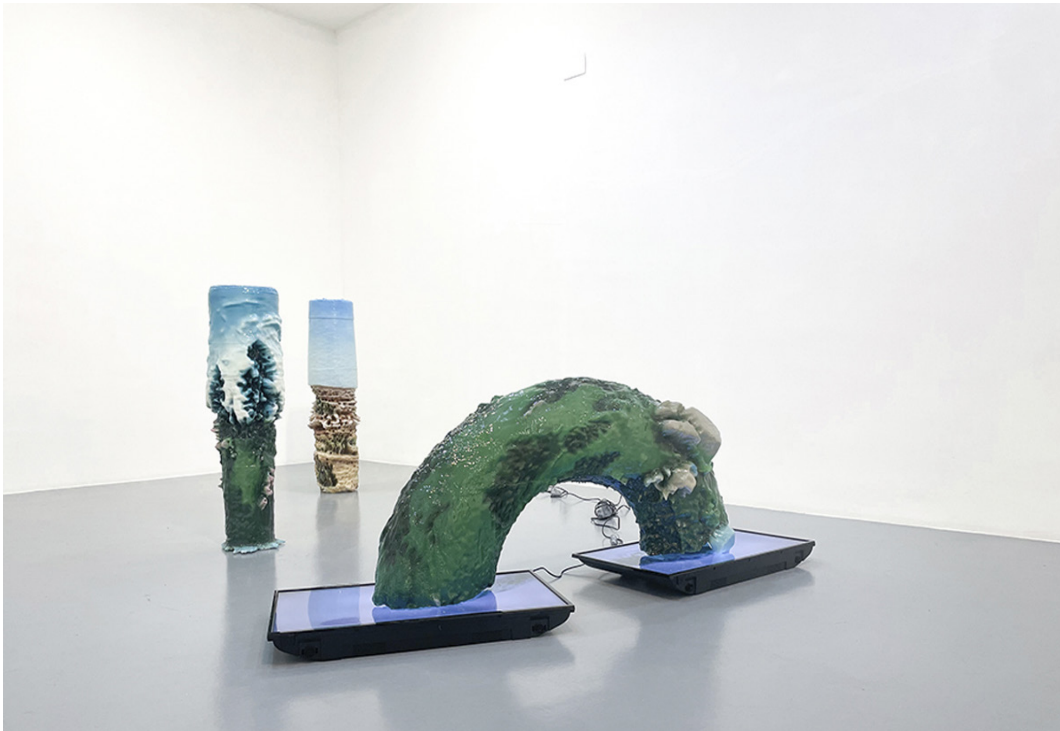
A non-apocalyptic future landscape of actual territory / A vision of a future land that only artificial intelligence will ever see / An empty Extremadura that no one will ever be able to contemplate Pintura acrílica y resina epoxi sobre impresión 3d en PLA. Medidas variables. 2023