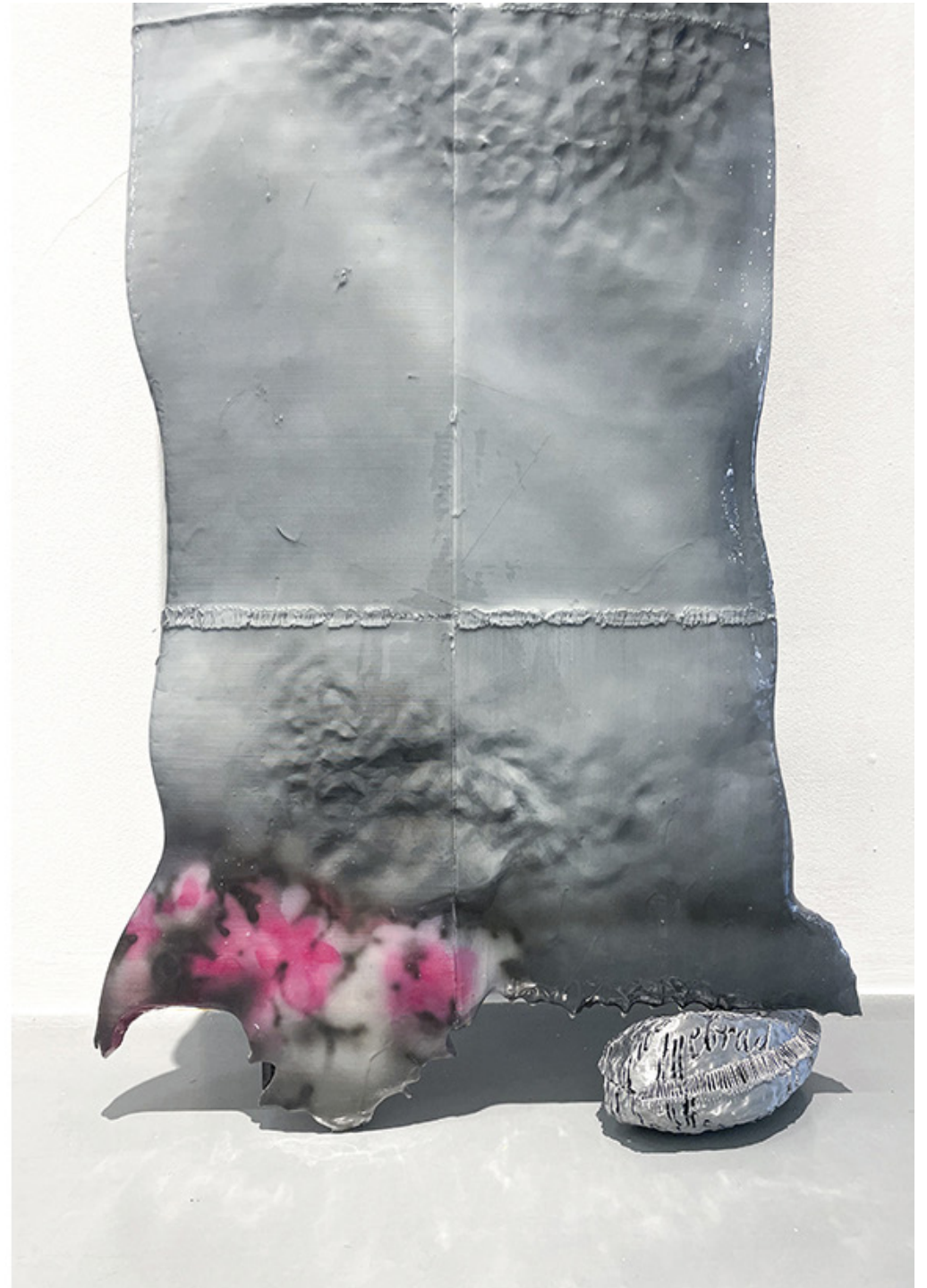
A future epitaph for today's society (1). Pintura acrílica y resina epoxi sobre impresión 3d en PLA. 120 × 55 x 09 cm. 2023