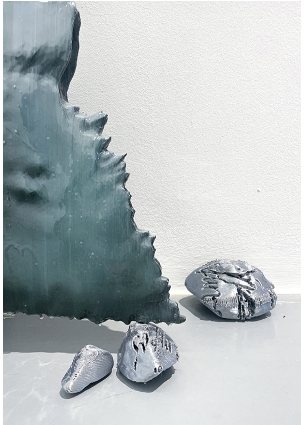
A future epitaph for today's society (2). Pintura acrílica y resina epoxi sobre impresión 3d en PLA. 120 × 60 × 10 cm. 2023