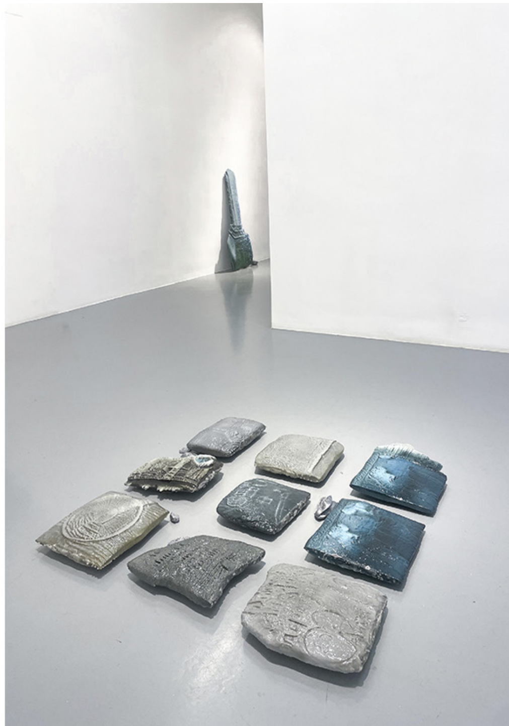
Ruinas del futuro. Impresión 3d en PLA. Medidas variables. 2023